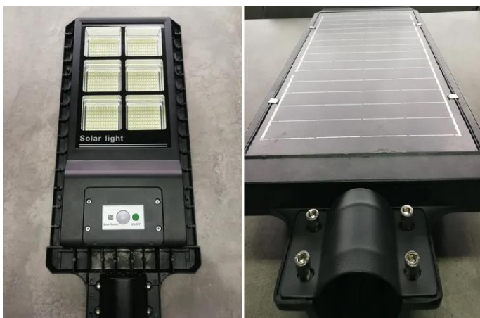
Imagen frente y reverso de artefacto. Preferentemente el panel solar en reverso del artefacto lumínico