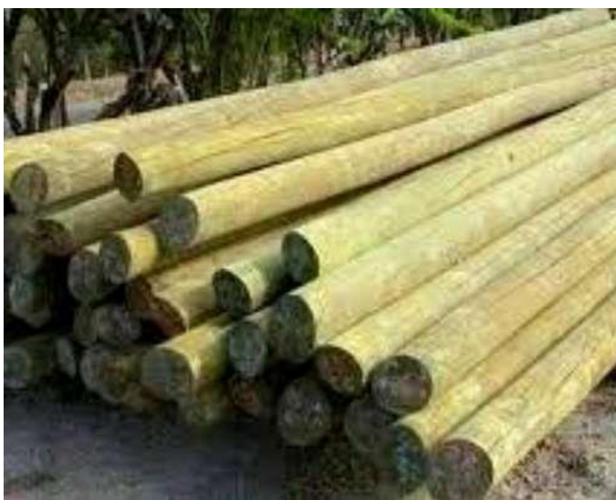
Postes madera de Eucalipto (impregnado autoclavado) tipo Eléctrico