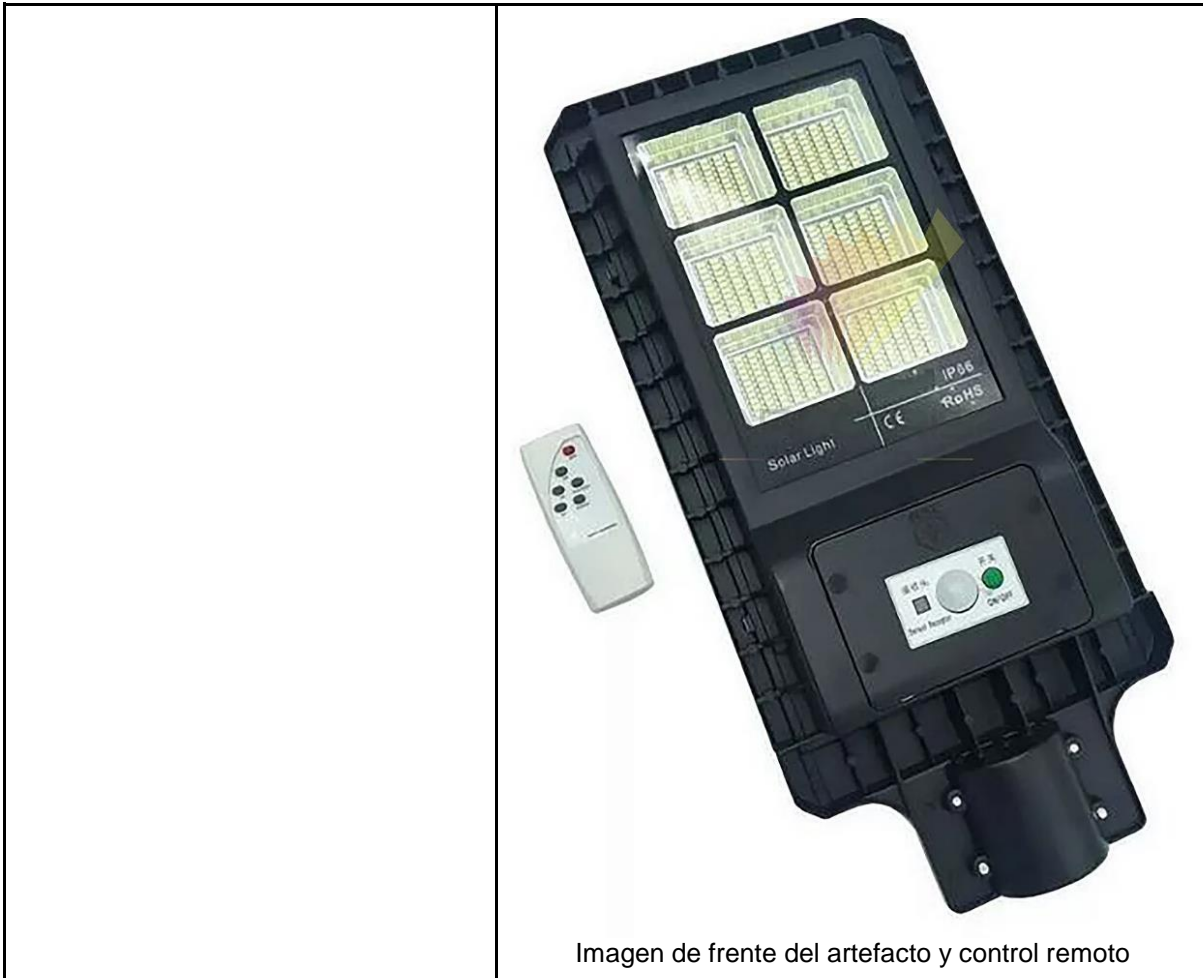
Imagen de frente del artefacto y control remoto