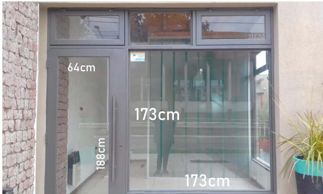
PLOTEO OFICINA LOCAL 3 FRENTE PLANTA BAJA