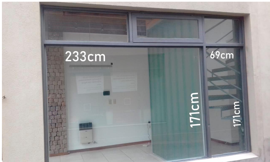
PLOTEO OFICINA LOCAL 3 LATERAL PLANTA BAJA